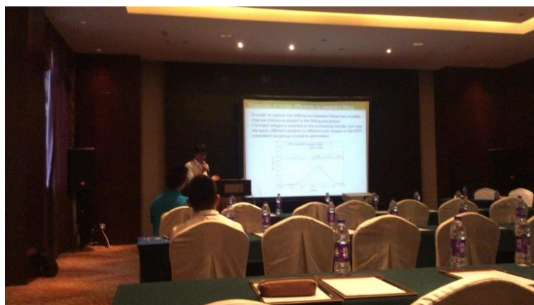
炉心解析セッションの様子 (写真は同研究室の学生)

閑話休題。学会の支部会と卒業論文の発表会程度の経験しか持たない私にとって、人数と緊張の度合いが正の相関関係にあるのは間違いなく、両手を挙げて成功したと呼べる発表ができたかどうかは怪しいところである。しかし、質疑において説明の足りていない前提や、新たな視点を得られたという点では有意義であったと言えるだろう。