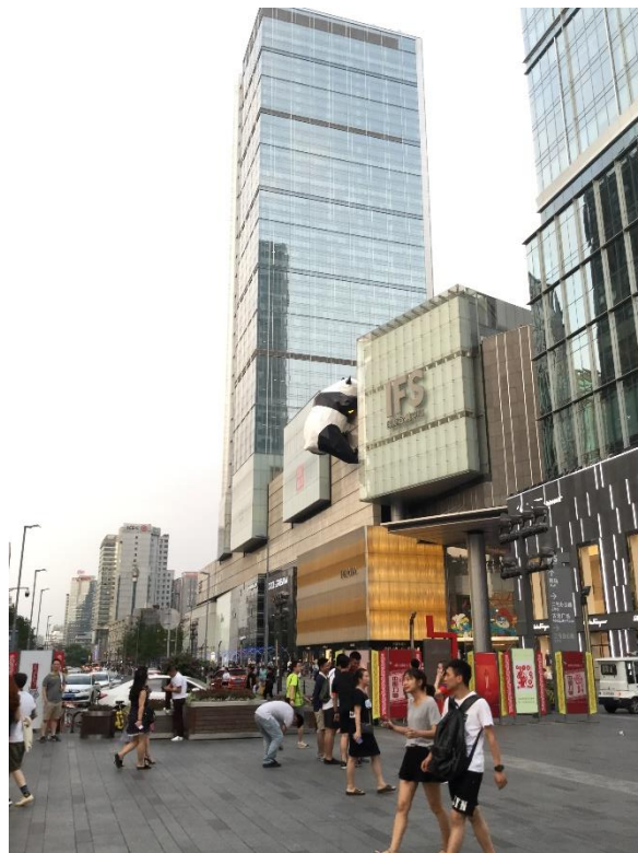
非常に発展した成都の中心街 (名物のパンダがビルにしがみついている)

私自身は北海道大学原子炉工学研究室の修士1年生として、原子力規制庁と共同で研究を行っている「Uncertainty Quantifications of Nuclides Number Densities after Fuel Depletion by Random Sampling Method (ランダムサンプリング法を用いた燃焼後核燃料の核種組成に対する不確かさ評価)」の成果報告に加え、初めて国際会議に参加するいち学生として、炉物理や会議そのものに対する経験を積むことを目的にこの会議へと参加した。参加の機会に対して、多大なる補助をいただいた日本原子力学会の炉物理部会には感謝してもしきれないほどである。今回は、そんな若手どころか若輩者である私が初の国際会議に参加し、発表や聴講を通じて得た経験を少しでも還元すべく筆を取った次第である。