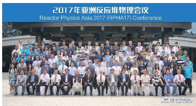
参加者集合写真、数多くの研究者が参加した (成都明悦ホテル前にて撮影)

事実、福島第一原子力発電所の事故を境に、原子力分野の研究や発展は衰えを見せたものの、二度とこのような事態が起きてはいけな い と『より安全に進んだ原子力システムを構築する』べく、多くの研究者が研究を続けてきた。その情報交換の場として、二回目となる今回は、2017年8月24日～25日の二日間にわたって中国、成都の成都明悦酒店（成都明悦ホテル）にて行われた。提出された論文総数は107編にのぼり、基礎となるモンテカルロ法や核データ評価から、集合体計算、燃焼計算、またその不確かさ評価について、さらに発展的な分野としてADSの研究や革新的な原子炉の設計に至るまで、さまざまな発表がなされた。加えて、前述の件もあつてか、放射線防護など安全に関する発表分野が見られたことが印象に残っている。